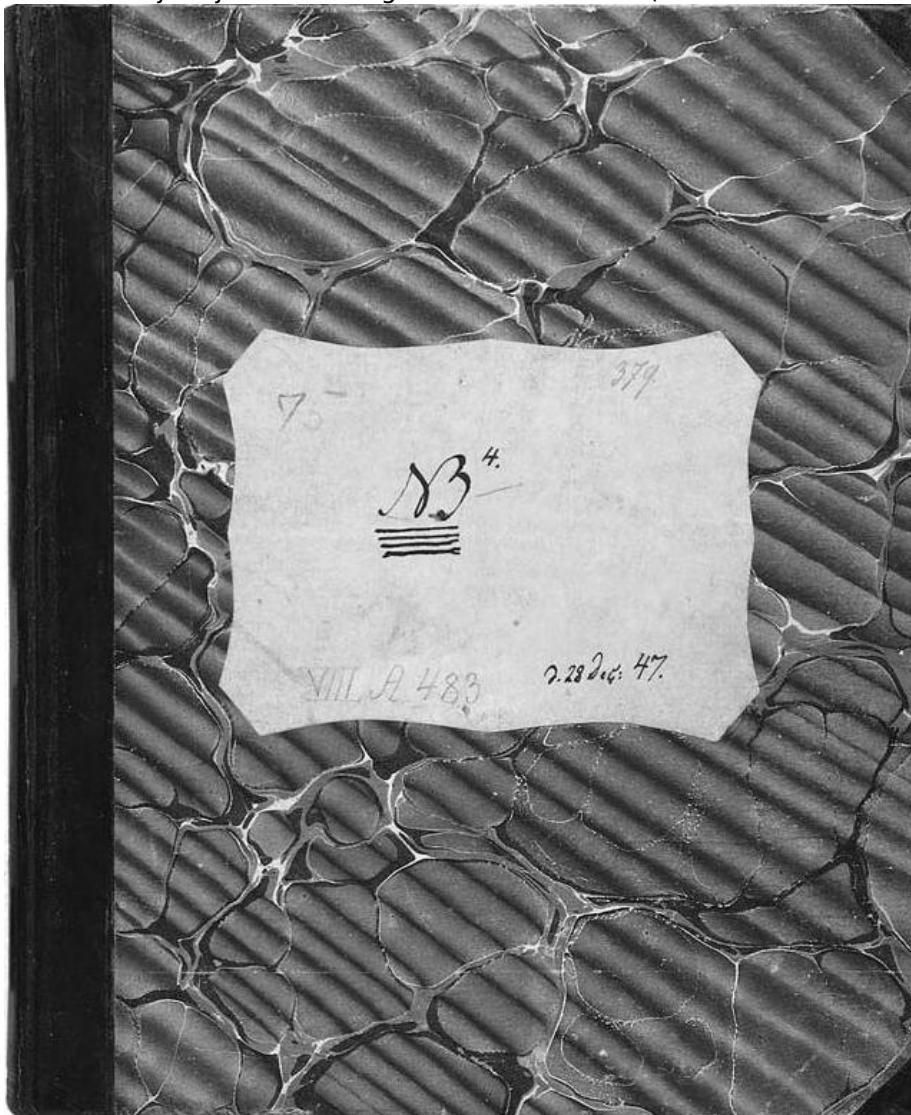
23. Journalen NB4, etiket på bindets forside ) . På indersiden af forpermen i øverste venstre hjørne findes en prisangivelse skrevet med blyant: »1 Rbd 1 Sk.«