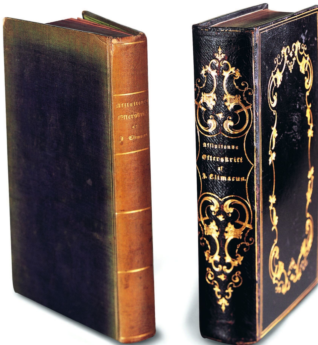
26. Afluttende uvidenskabelig Efterskrift (1846). Til venstre: Til J.L. Heiberg; helbind af shirting med guldsnit (Dedikation 26). Til højre: Til J.P. Mynster; helbind af sort safian med guldtrykte dekorationer på ryg og permer samt guldsnit, trykt på tykt papir (Dedikation 27). Begge i privateje Til