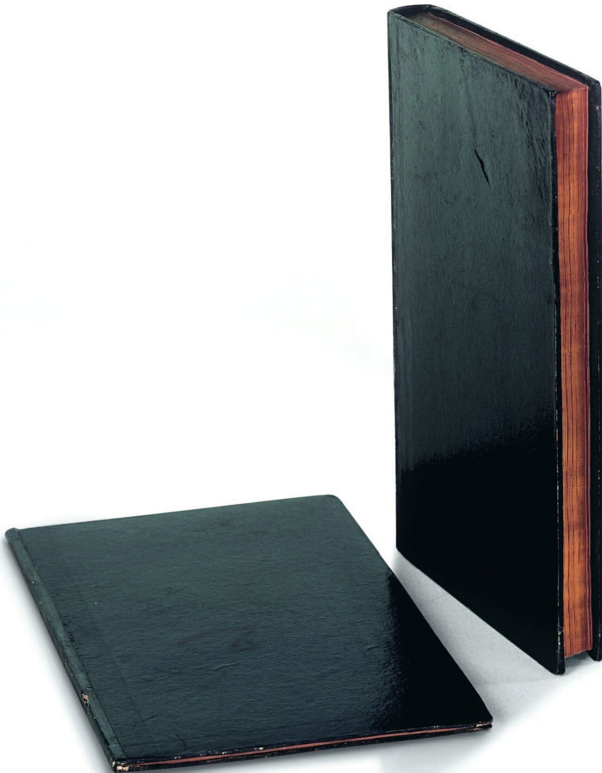
28. To gavebøger indbundet i det karakteristiske sorte glanspapir og forsynet med tresidet guldsnit. Liggende: »Ypperstepræsten« - »Tolderen« - »Synderinden« (1849); stående: Indøvelse i Christendom (1850). Begge i privateje