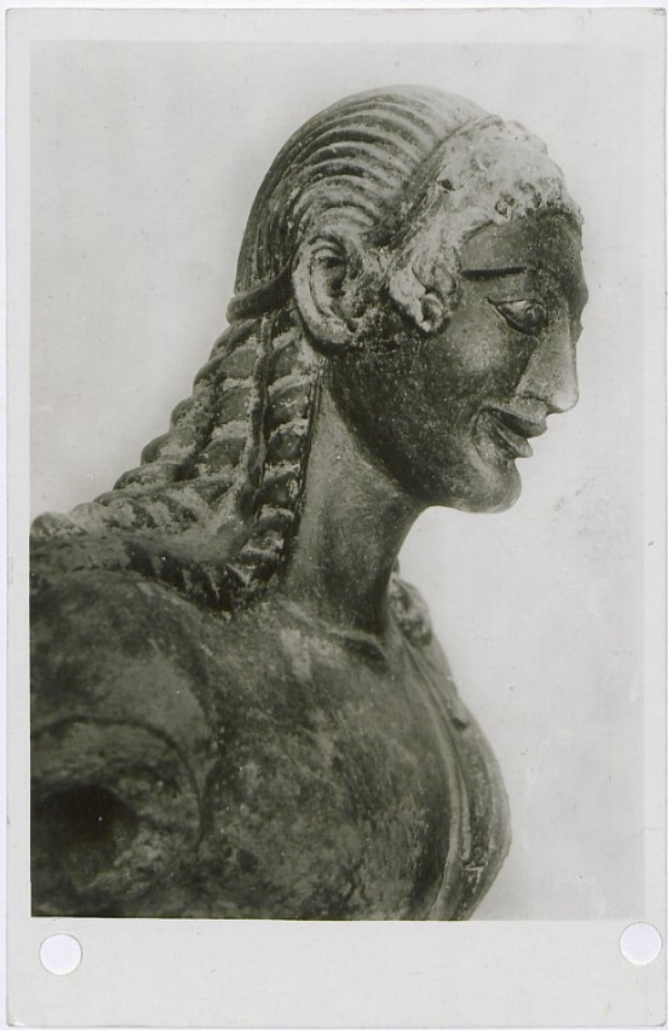
30. ROMA - Museo Nazionale di Villa Giulia. Apollo di Veio: la testa veduta di profilo (Terracotta di Arte Etrusca, VI-X sec. a. C.)