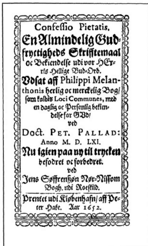
Facsimile af Titelbladet til Udgaven af „Et almindeligt Skriftemaal“ 1652.